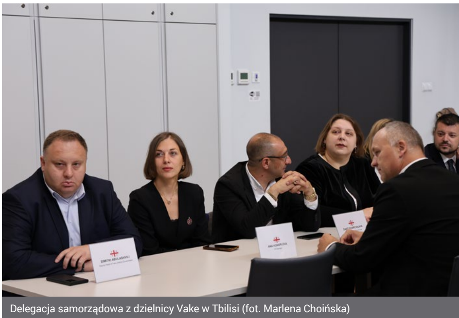
Delegacja samorządowa z dzielnicy Vake w Tbilisi

– Takie spotkania zbliżają nasze społeczności, stwarzając okazję do dialogu i wspól-