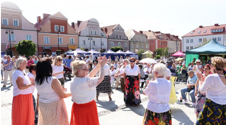
Łomżyńscy seniorzy jak zwykle tłumnie zjawili się na Starym Rynku

Miejskie Przedsiębiorstwo Wodociągów i Kanalizacji przygotowało stoisko z wodą. Ze swoją propozycją pojawiła się także SOWA, czyli Strefa Odkrywania Wyobraźni i Aktywności. Stowarzyszenie „Czas Rozwoju” zaproponowało malowanie twarzy oraz kreatywne warsztaty.