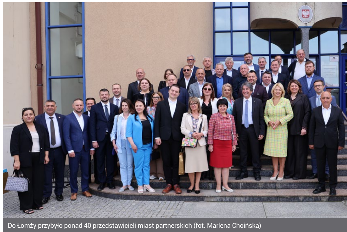
Do Łomży przybyło ponad 40 przedstawicieli miast partnerskich

– Tu mamy przyjaciół z dobrym sercem i cenimy pomoc, którą otrzymaliśmy w momencie wybuchu wojny – wypowiadał się