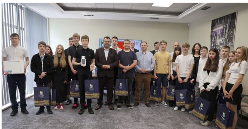
Uczestnicy I Olimpiady Wiedzy o Ciepłownictwie i Zielonej Energii