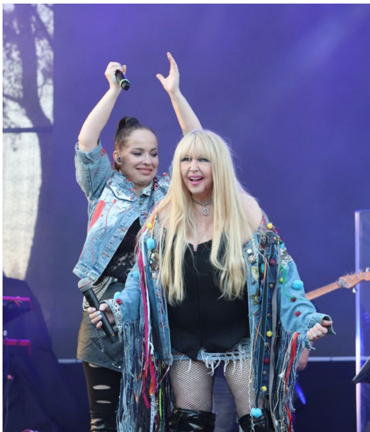
Maryla Rodowicz wyśpiewała swoje największe hity