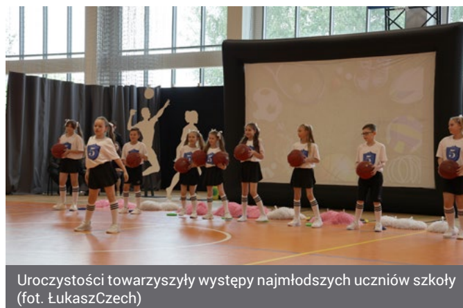
Uroczystości towarzyszyły występy najmłodszych uczniów szkoły