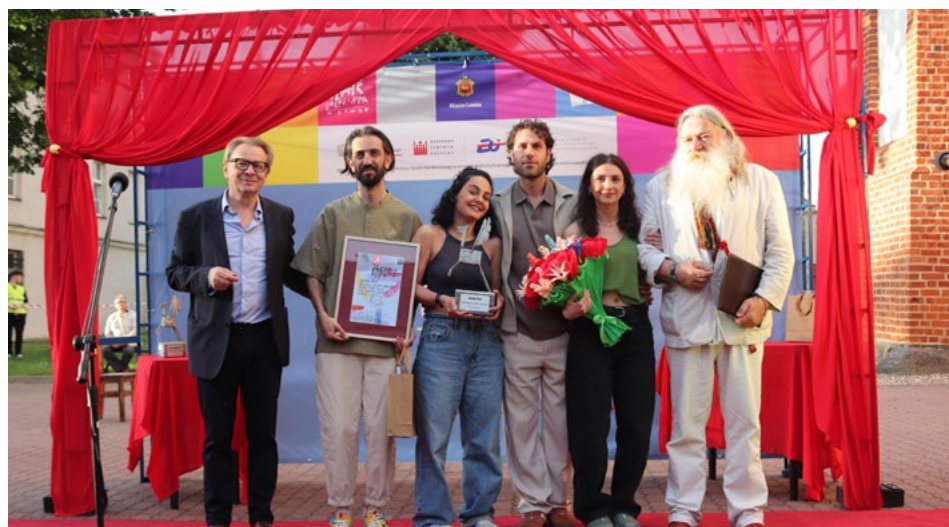
Aktorzy z National Puppet Theatre after Hovhannes Toumanian z Armenii zgarnęli Grand Prix

Spektakl „Bukowski” w wykonaniu National Puppet Theatre after Hovhannes Toumanian z Armenii otrzymał Grand Prix 38. Międzynarodowego Festiwalu Teatralnego „Walizka”. Statuetka oraz nagroda w wysokości 10 tys. zł, ufundowana przez Ministra Kultury i Dziedzictwa Narodowego, została przyznana za artystyczne studium przypadku i wyrazistą teatralizację postaci Charlesa Bukowskiego.