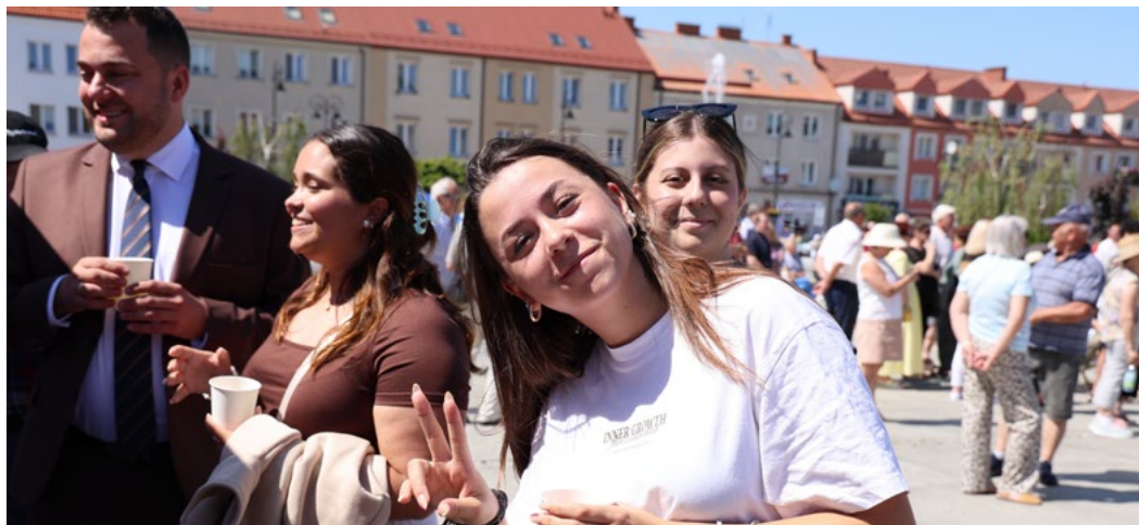
Młodzież z Hiszpanii podczas „Seniorady Plus”