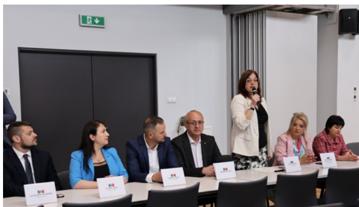
Od lewej delegacja z mołdawskiej Leovy i bułgarskiego Kazanlyka