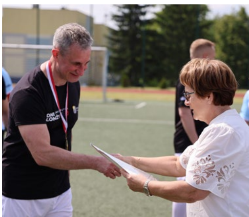
Po meczu każdy otrzymał pamiątkowy dyplom