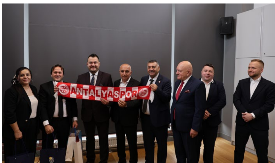
Delegacja z dzielnicy Muratpaşa w Antalyi