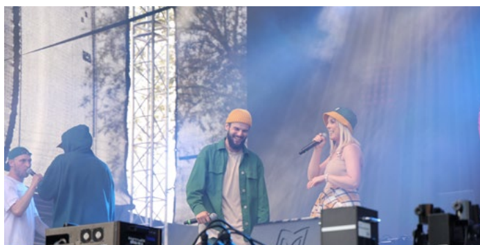
Pochodząca z Łomży grupa Potwory i Spółka