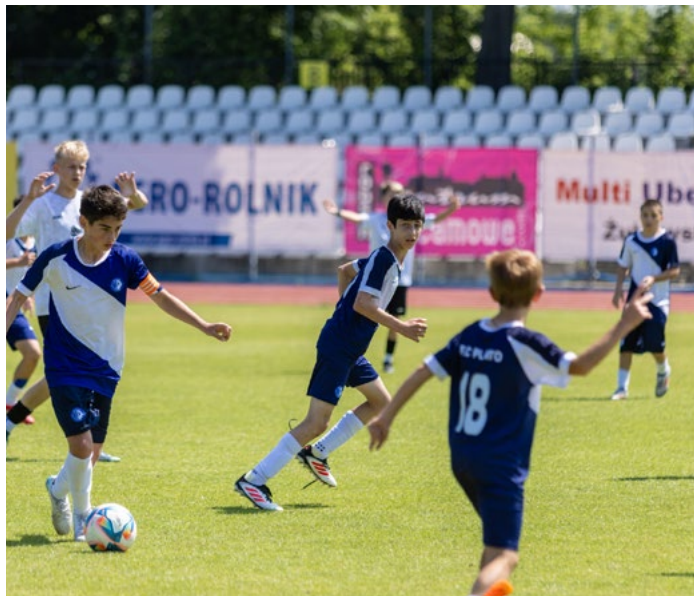
Przy piłce młodzi zawodnicy Plato Tbilisi

Turniej „Łomża Cup” został zapoczątkowany kilka lat temu przez działaczy i trenerów Młodzieżowego ŁKS-u oraz „Rodziców Kibiców”. W tegorocznej edycji wzięło udział 12 zespołów z kilku ośrodków Polski oraz z Litwy i Gruzji.