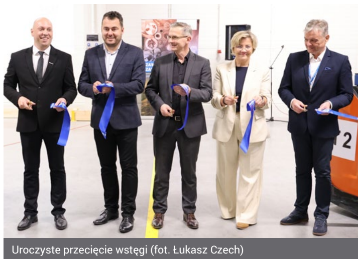
Uroczyste przecięcie wstęgi

Swoją oddział w Łomży otworzyła 1 kwietnia 2008 roku, wynajmując pomieszczenia składowe. W odpowiedzi na rosnące potrzeby rynku w 2021 roku zakupiła nieruchomość, na której w listopadzie 2023 roku rozpoczęła budowę wła-