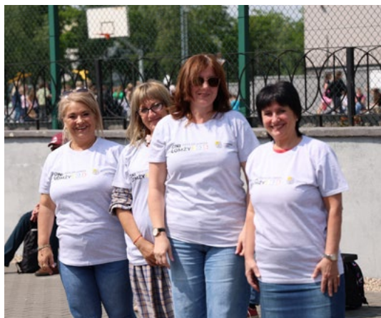
Delegacja z bułgarskiego miasta Kazanłyk