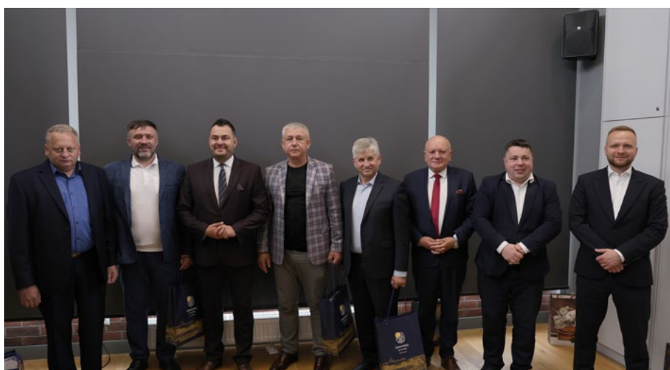
Przedstawiciele ukraińskiego Zviahla