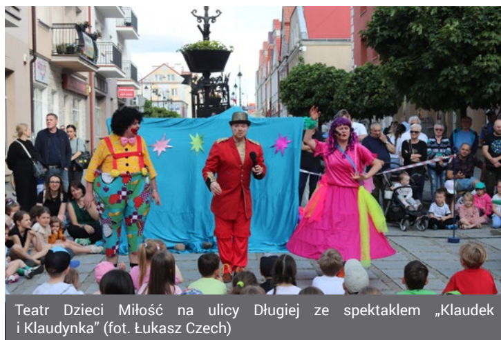
Teatr Dzieci Miłość na ulicy Długiej ze spektaklem „Klaudek i Klaudynka”