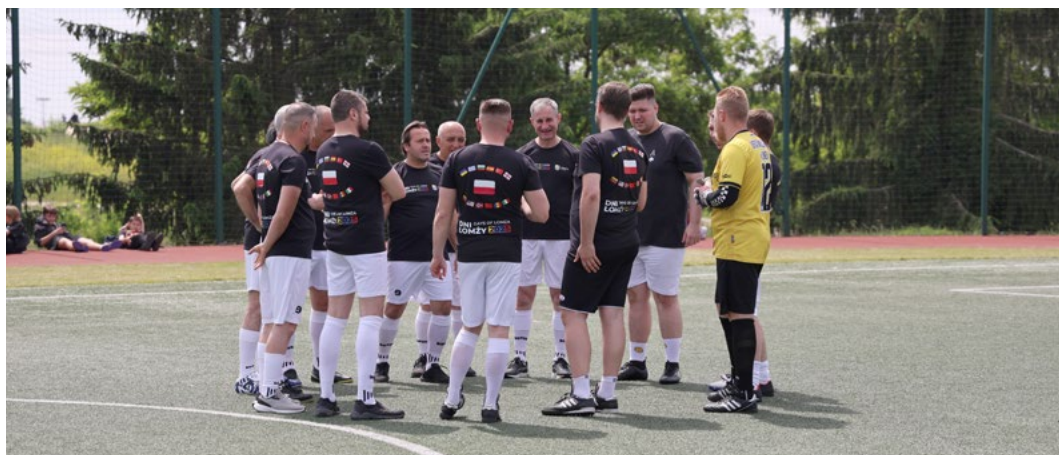
Przedmeczowa narada drużyny delegacji zagranicznych