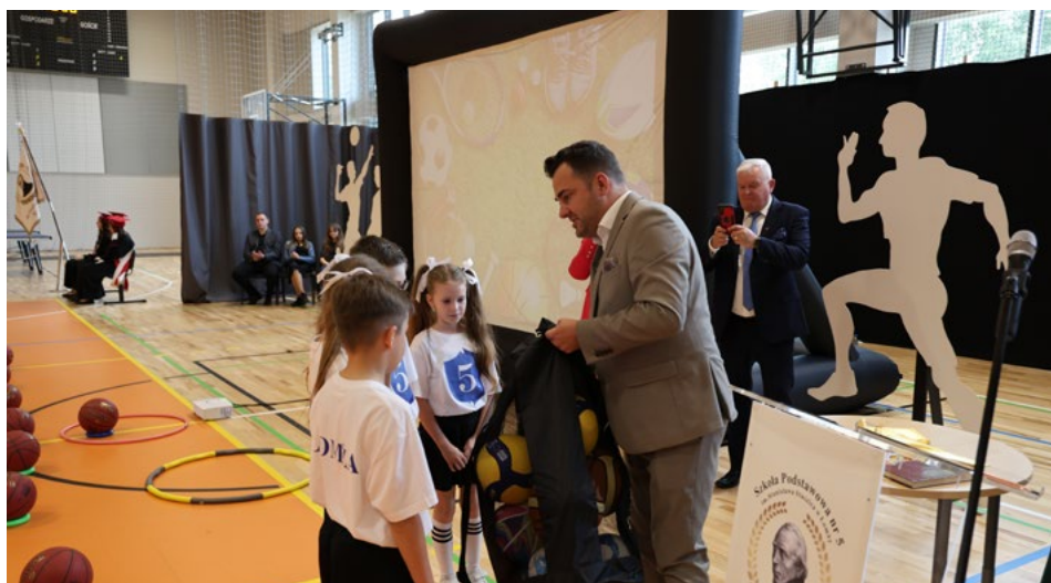
Prezydent Łomży Mariusz Chrzanowski przekazał uczniom piłki do zajęć sportowych

Część artystyczna przygotowana przez uczniów, symboliczne przecięcie wstęgi oraz okolicznościowe przemówienia zaproszonych gości. Szkoła Podstawowa nr 5 w Łomży świętowała wybudowanie i otwarcie długo wyczekiwanego obiektu nie tylko przez społeczność szkolną i pobliskie osiedla, ale też całą Łomżę i jej środowisko sportowe.