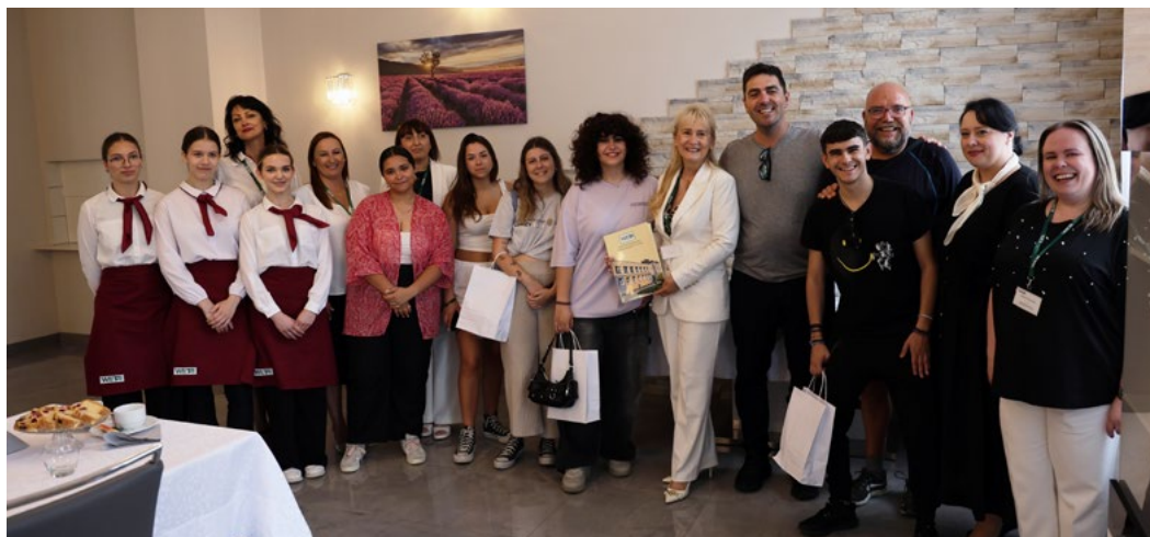
Wizyta w łomżyńskiej „Wecie”

Młodzież z Półwyspu Iberyjskiego spotkała się ze swoimi rówieśnikami z Młodzieżowej Rady Miejskiej Łomży w celu wymiany doświadczeń oraz wyznaczenia dalszych kierunków współpracy.