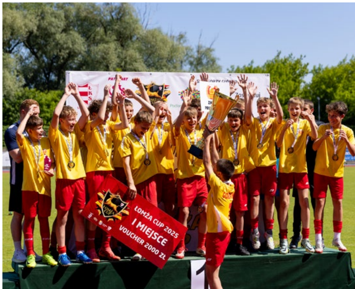
Turniej wygrał zespół Znicza Pruszków

W dniach 14 – 16 czerwca na Stadionie Miejskim w Łomży odbyła się kolejna edycja turnieju „Łomża Cup”. Młodzi piłkarze rywalizowali w roczniku 2012, a najlepszy okazał się Znicz Pruszków.