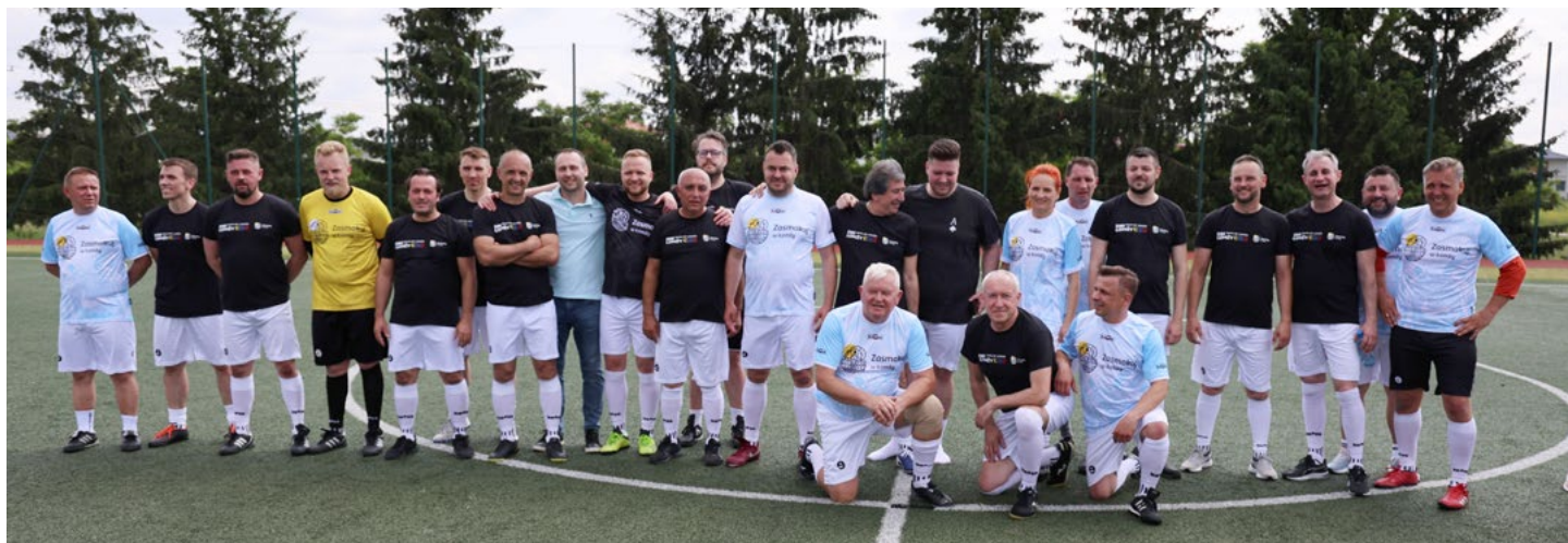
Uczestnicy międzynarodowego meczu

Jednym z akcentów tegorocznych obchodów Dni Łomży był mecz piłkarski pomiędzy Urzędem Miejskim a drużyną miast partnerskich. Sportowa rywalizacja odbywała się na terenie Szkoły Podstawowej nr 10 i przyniosła dużo pozytywnych emocji zarówno na boisku, jak i poza nim.