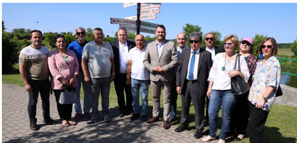
Wspólne zdjęcie delegacji z Gruzji, Hiszpanii, Turcji oraz Grecji

Podczas tegorocznych Dni Łomży odbyło się uroczyste odsłonięcie tablic na drogowskaziach miast partnerskich, znajdującym się na terenie bulwarów nadnarwiańskich. Uczestniczyli w nim przedstawiciele delegacji z Gruzji, Hiszpanii oraz Turcji.