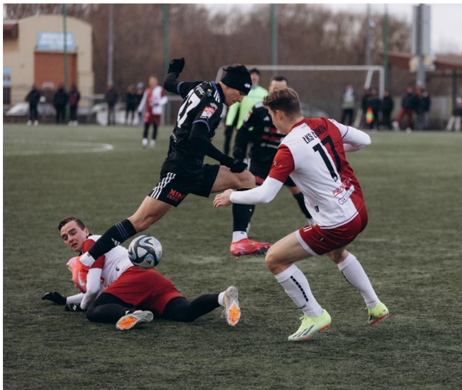
Mecz sparingowy ŁKS-u z Wigrami Suwałki

Z optymizmem i nadziejami przystępują do rundy wiosennej piłkarze ŁKS-u Łomża. Przygotowania biało-czerwoni rozpoczęli już w styczniu. Celem jaki przyświeca drużynie, jest zajęcie co najmniej drugiego miejsca i gra w barażach o II ligę.