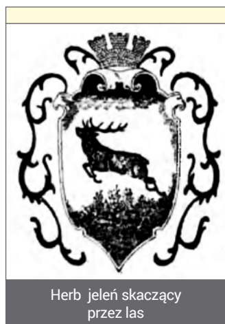
Herb jeleni skaczący przez las