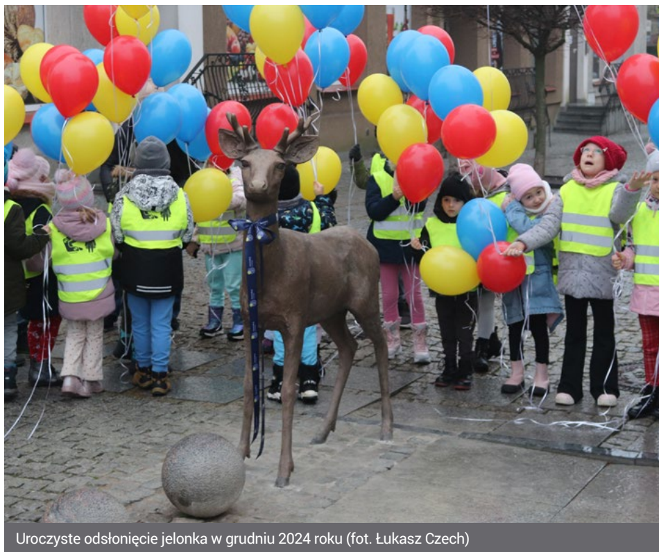
Uroczyste odsłonięcie jelonka w grudniu 2024 roku

Posąg młodego jelenia usytuowany u zbiegu ulic Farnej i Długiej zostanie nazwany Łomżusiem. Tak zdecydowali mieszkańcy, którzy oddali swoje głosy na profilu Prezydenta Miasta Łomża Mariusza Chrzanowskiego na Facebooku. Propozycje nazw przedkładali nie tylko internauci, ale również uczniowie klas I-III szkół podstawowych naszego miasta. Okazało się, że największą przychylność mieszkańców Łomży zyskało imię Łomżuś zgłoszone przez klasę 2a ze Szkoły Podstawowej nr 10.