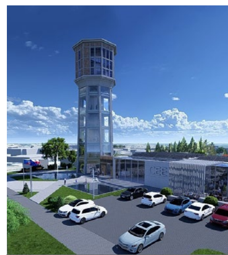
Modernizacja wieży ciśnień jest jednym z priorytetów w Funduszach Szwajcarskich

- Złożony przez Miasto Łomża projekt obejmuje 8 działań podstawowych w skład których wchodzi kilkanaście poddziałań o łącznej wartości 85,5 mln zł, na który za-