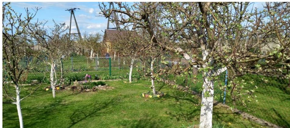
Biały kolor wapna odbija promienie słoneczne i ogranicza nagrzewanie

Na pierwszy rzut oka wydawać by się mogło, iż okres zimowy to czas, w którym ogrody działkowe zapadają w letarg, niczym niedźwiedzie w swych gawrach. Czy aby na pewno? Choć za oknami śnieg i mróz lub w związku z coraz cieplejszym klimatem może bardziej trafnie plucha i chłód, są pewne prace, które muszą być wykonane przed nadejściem wiosny.