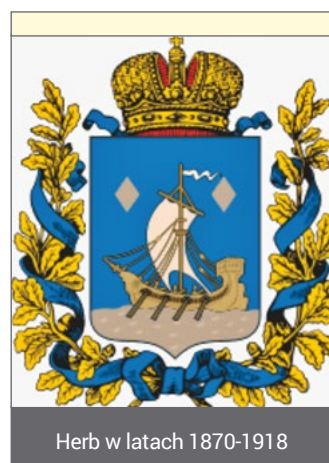
Herb w latach 1870-1918