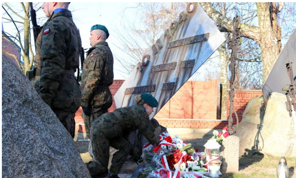
Łomżyńskie uroczystości upamiętniające pierwszą wywózkę na Syberię

Złożeniem kwiatów w Dolinie Pamięci przy Sanktuarium Miłosierdzia Bożego uczcili członkowie Związku Sybiraków, przedstawiciele łomżyńskiego samorządu, wojskowi, harcerze oraz licznie przybyłe delegacje szkół i organizacji pozarządowych 85. rocznicę wywózki mieszkańców ziemi łomżyńskiej w głąb Związku Sowieckiego.