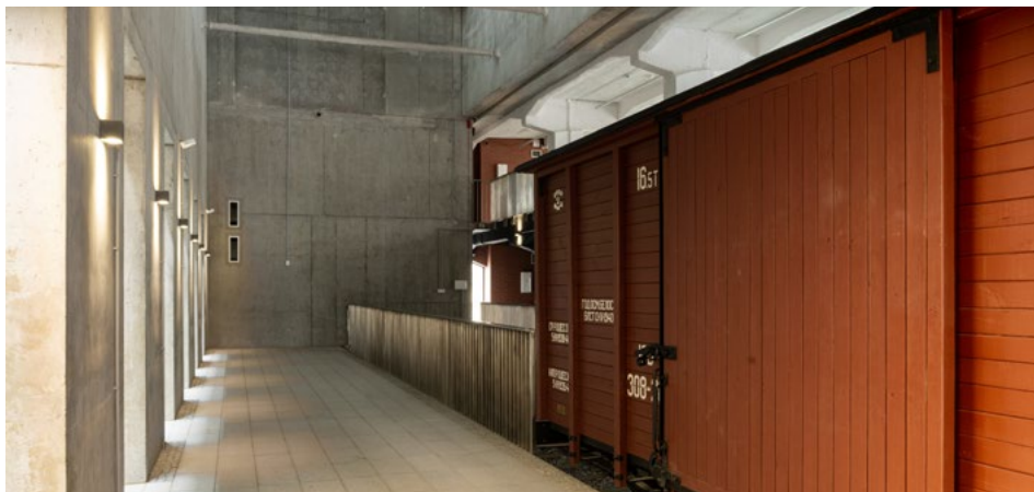
Wagon towarowy „ciepłuszka” w Muzeum Pamięci Sybiru w Białymstoku