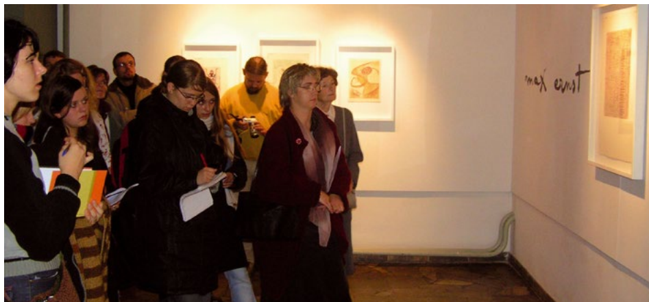
Październik 2004. Wystawa grafik Maxa Ernsta pt. „Max Ernst”

Galeria Pod Arkadami działa od 1980 roku i jest najstarszą nieprzerwanie istniejącą galerią łomżyńską. To tutaj wykuwa się życie artystyczne naszego miasta. W budynku mieszczącym się przy Starym Rynku gościło wielu uznanych twórców z kraju i zagranicy, a także przedstawicieli lokalnego środowiska artystycznego.