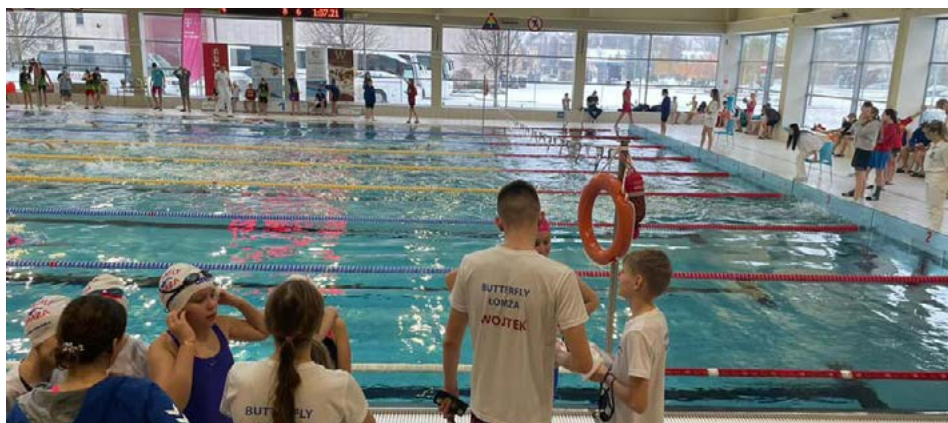
Łomżyńscy pływacy spisali się w Suwałkach wyścigiem