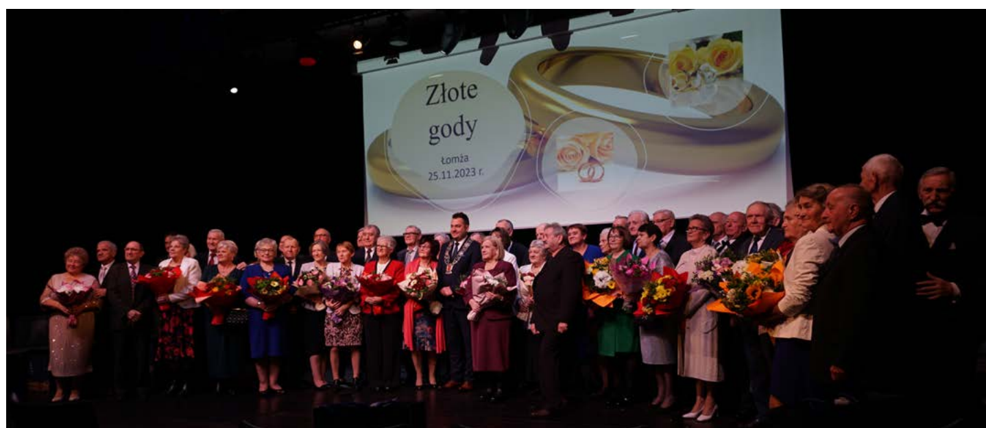
Uczestnicy „Złotych Godów” z dnia 25 listopada 2023 roku – II tura