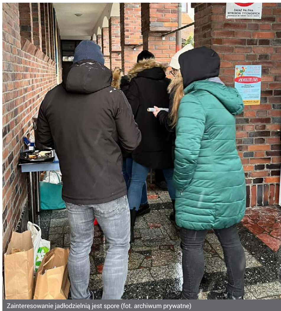
Zainteresowanie jadłodzielnią jest spore

i szafkach można pozostawiać artykuły żywnościowe oraz środki czystości, z których będą mogli skorzystać potrzebujący. Jadłodzielnia jest czynna siedem dni w tygodniu, przez całą dobę. Dodatkowo w każdą sobotę w godzinach 12.00-14.00 serwowana jest ciepła zupa.