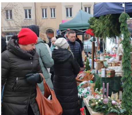
Bożonarodzeniowy Jarmark „Zasmakuj w Łomży”

W sobotę 23 grudnia 2023 r. w godz. 9:00-12:00 prezydent Mariusz Chrzanowski zaprasza potrzebujących do odbioru posiłku w ramach akcji „Wigilijny stół”. Świąteczne potrawy wydawane będą na wynos w formie paczek w autobusach MPK zlokalizowanych na Starym Rynku, na parkingu przy Parku Wodnym (ul. Wyższyńskiego) oraz pętli autobusowej w rejonie ulic Studenckiej i Wojska Polskiego. Natomiast w niedzielę 24 grudnia na Starym Rynku zaparkuje autobus, w którym można będzie napić się kawy i herbaty oraz skosztować makowca.