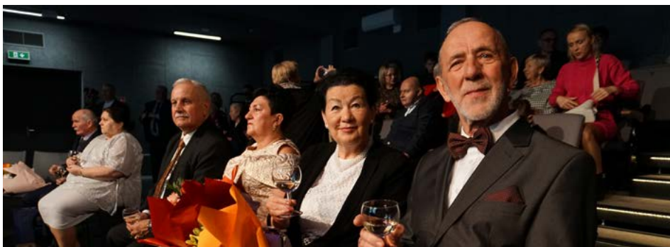
Podczas uroczystości nie zabrakło tradycyjnej lampki szampana