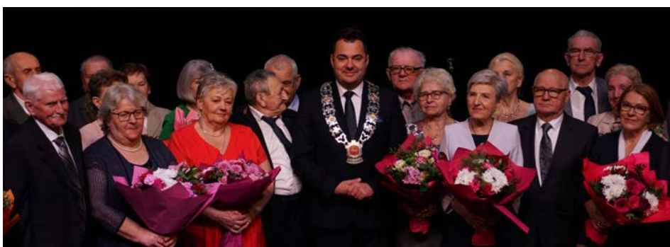
Uczestnicy „Złotych Godów” z dnia 25 listopada 2023 roku – I tura