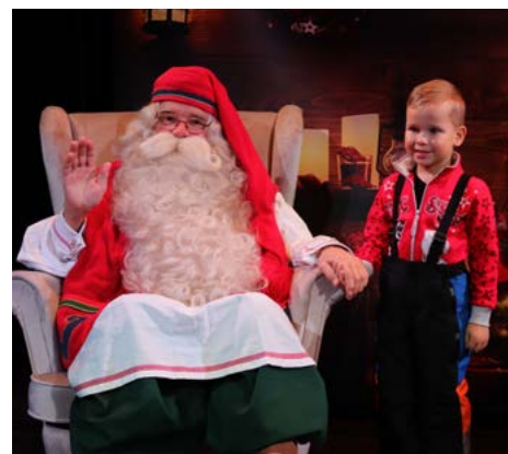
Fotosesja z Mikołajem w Hali Kultury