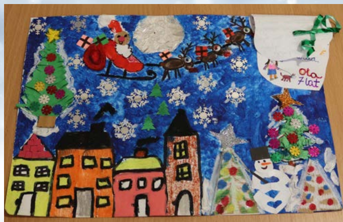
Praca Aleksandry Świączkowskiej zwyciężyła w kategorii szkół podstawowych