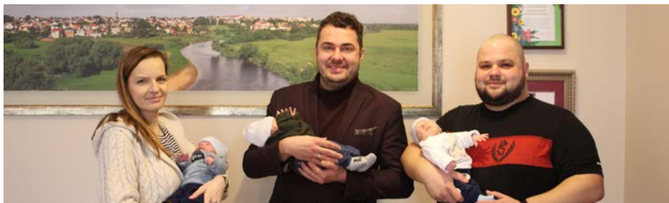
Państwo Trycowie z nowo narodzonymi maluchami w gabinecie prezydenta Łomży. Zdjęcie pochodzi z lutego bieżącego roku

Od 2024 roku samorządowe gminne jednorazowe świadczenie z tytułu urodzenia się dziecka będzie wypłacane w wysokości 1500 zł. Taką uchwałę na wniosek prezydenta Mariusza Chrzanowskiego podjęła Rada Miejska Łomży. Tradycyjnie oprócz finansowego wsparcia, rodzice noworodków otrzymają wyprawkę.