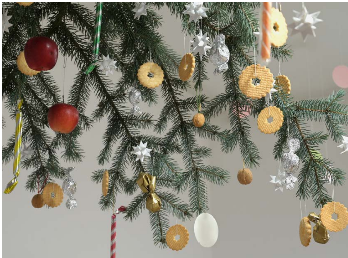
Świąteczna choinka

- Na choinkach było więcej łakoci dla dzieci, zazwyczaj przemysłnie ukrytych, a także różnych kolorowych ozdób robionych we własnym zakresie, takich jak aniołki, baletnice, języki czy bombki z bibuły. Głównie aniołków, baletnic, paski na białe gwiazdki, bibułę, czy kolorowy papier można było kupić w papierniczym sklepie. Potrzebne fragmenty ozdób choinkowych wycinano także z kolorowych czasopism oraz złotka i sreberka po słodyczach. W klipsowych lichtarzykach stały świece choinkowe, których światło odbija-