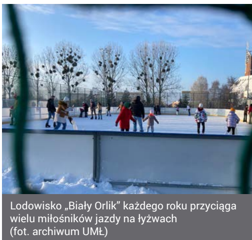
Lodowisko „Biały Orlik” każdego roku przyciąga wielu miłośników jazdy na łyżwach

Dostępna jest także wypożyczalnia płóz i łyżew od rozmiaru 26 do 46. Zaczynając swoją przygodę z łyżwami mogą wypożyczyć kaski i pingwiny, które ułatwiają stawianie pierwszych kroków na lodzie.