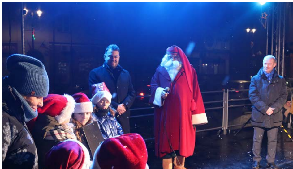
Gość z Laponii przywitał się z mieszkańcami ze sceny Starego Rynku