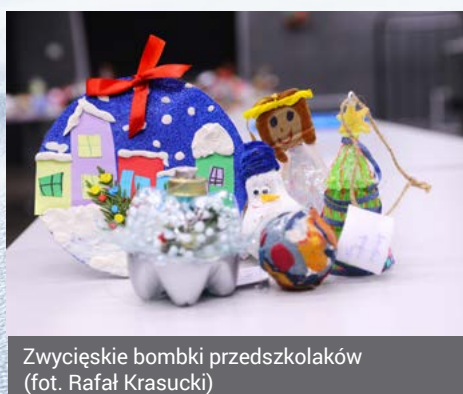
Zwycięskie bombki przedszkolaków