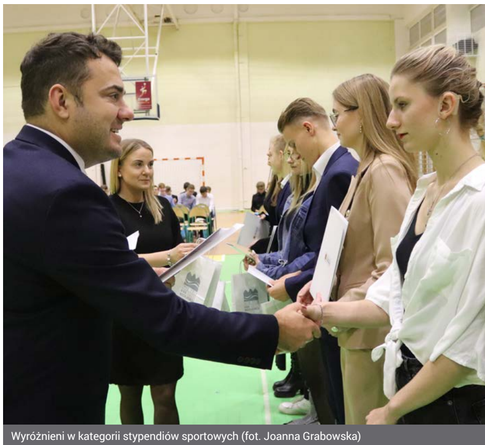
Wyróżnieni w kategorii stypendiów sportowych