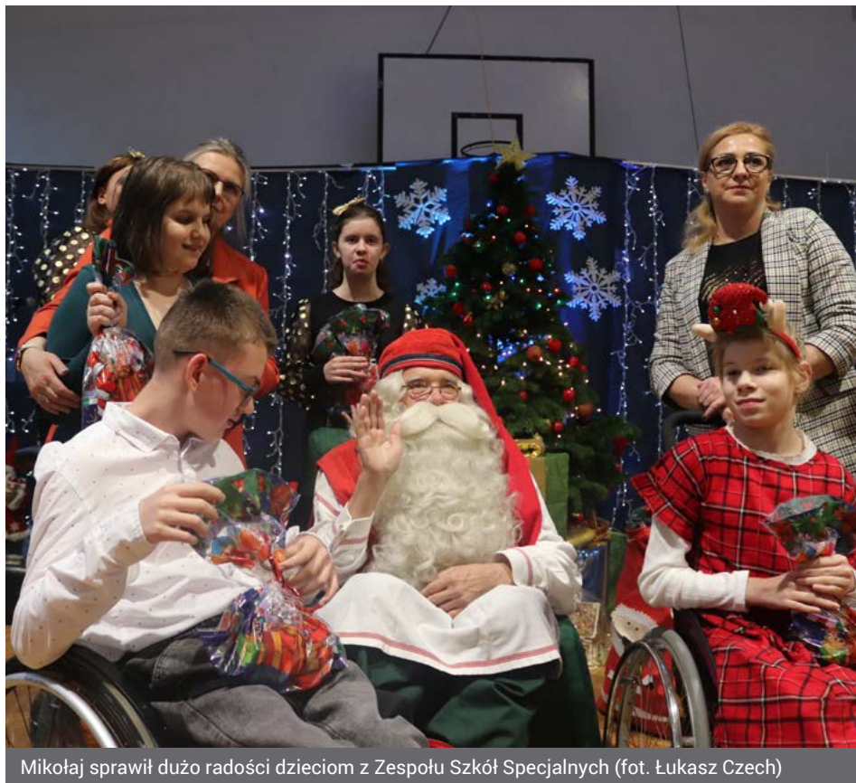
Mikołaj sprawił dużo radości dzieciom z Zespołu Szkół Specjalnych

To był dzień pełen wrażeń, szczególnie dla najmłodszych. Do Łomży, prosto z Laponii, przybył Święty Mikołaj, a wraz z nim worek prezentów i prawdziwe renifery.