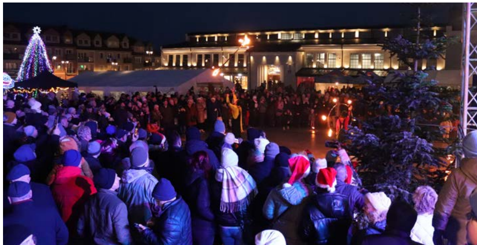
Wigilii miejskiej towarzyszył pokaz ognia w wykonaniu Teatru Los Fuegos

Na Starym Rynku odbyła się Łomżyńska Wieczerza Wigilijna, zorganizowana przez władze samorządowe Łomży. Nie zabrakło kolęd, łamania się opłatkiem i składania sobie życzeń oraz smakowania wigilijnych potraw. Wydarzenie poprzedził Bożonarodzeniowy Jarmark „Zasmakuj w Łomży”.