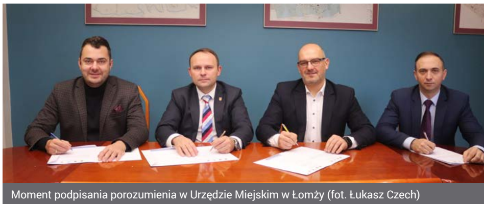
Moment podpisania porozumienia w Urzędzie Miejskim w Łomży

Miasto Łomża, Gmina Łomża, Gmina Nowogród oraz Gmina Piątnica przyjęły Strategię Zintegrowanych Inwestycji Terytorialnych w ramach Miejskiego Obszaru Funkcjonalnego. Dzięki temu samorządy mogą ubiegać się o wsparcie finansowe z Programu Regionalnego Fundusze Europejskie dla Podlaskiego 2021-2027, jak również z Funduszy Europejskich dla Polski Wschodniej. Na cały obszar to kwota prawie 197,5 mln zł, w tym dla Miasta Łomża ponad 135 mln zł.