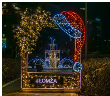
Świąteczne monidło z fontanną w tle w Parku Jana Pawła II – Papieża Pielgrzyma