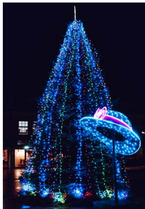
Świąteczna choinka i świetlny kapelusz na Starym Rynku

To są nowości, ale oprócz nich Park JP II został przyozdobiony dobrze znanymi już dekoracjami. Przy wejściu do parku od ul. Zawadzkiej przechodniów wita piernikowy domek, dalej w głąb ustawiona jest kolorowa ciuchcia z wagonikami