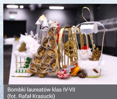
Bombki laureatów klas IV-VII