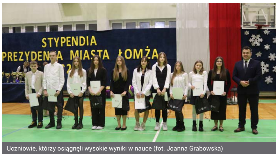
Uczniowie, którzy osiągnęli wysokie wyniki w nauce