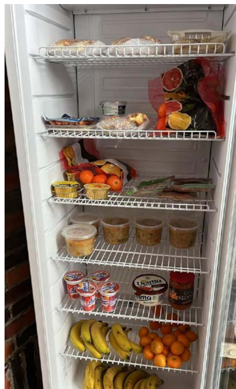
Lodówka wypełniona produktami spożywczymi

Kolejnym projektem, który wypłynął z inicjatywy zaangażowanych w działalność dobrodzielnia osób, jest jadłodzielnia. W specjalnie przygotowanych lodówkach