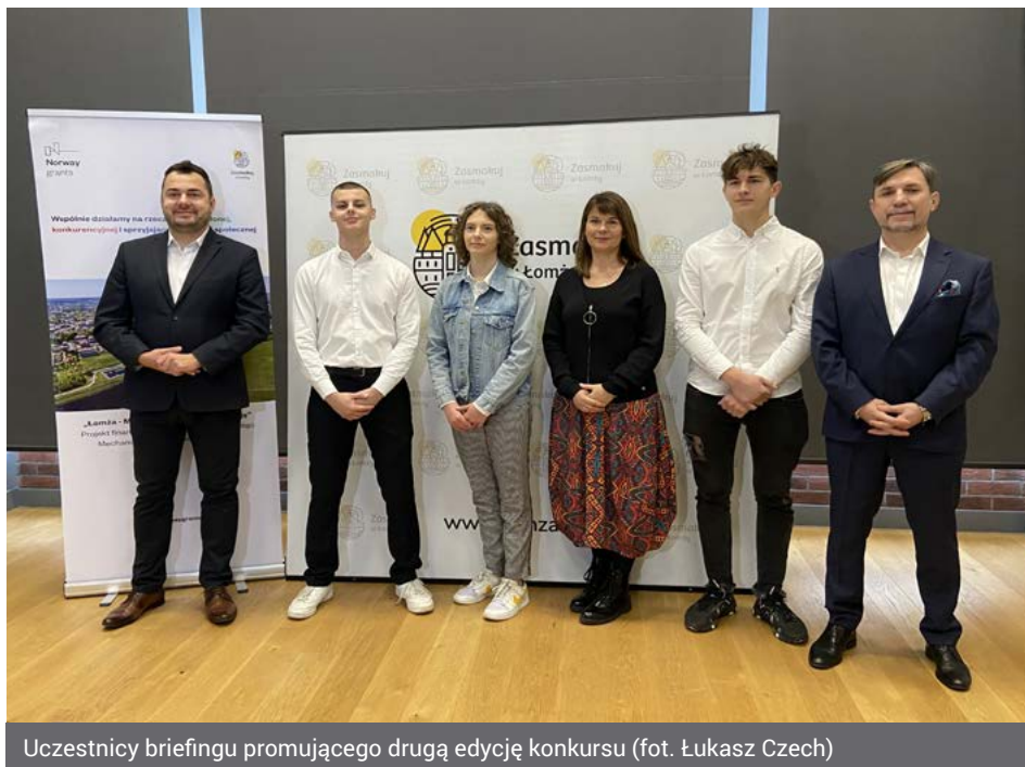
Uczestnicy briefingu promującego drugą edycję konkursu

Do końca stycznia 2024 r., młodzież ucząca się w łomżyńskich szkołach ponadpodstawowych, może zgłosić swój pomysł biznesowy wraz z biznesplanem do udziału w konkursie „Mój pomysł na biznes – Zabiznesuj w Łomży”. Do wygrania są nagrody w postaci voucherów o wartości od 2 000 do 5 500 zł.