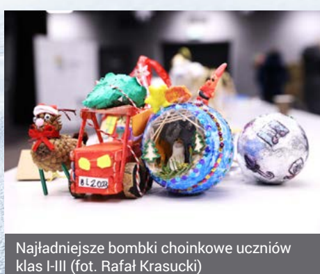
Najładniejsze bombki choinkowe uczniów klas I-III