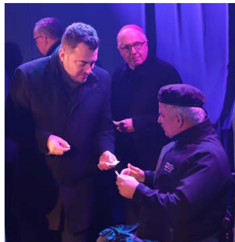
Tradycyjny opłatek i życzenia świąteczne

Po złożeniu sobie życzeń i przełamaniu się opłatkiem można było skosztować tradycyjnych potraw wigilijnych, m.in. czerwonego barszczu z uszkami, sałatki śledziowej, pierogów z kapustą i grzybami, ryby po grecku czy klusek z makiem, a także słodkie ciasta. Świąteczne posiłki przygotowane zostały przez pracowników i podopiecznych Burs Szkolnych nr