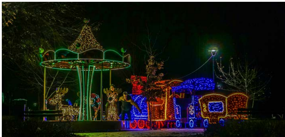
Obrotowa karuzela z reniferami i kolorowa ciuchcia w Parku Jana Pawła II – Papieża Pielgrzyma

Fontanna z animacją świetlną na Starym Rynku, obrotowa karuzela z reniferami napędzana siłą mięśni w Parku Jana Pawła II – Papieża Pielgrzyma i świetlny kapelusz przy choince – to nowości, które uatrakcyjniły miasto w okresie świątecznym i cieszą oko przechodniów.