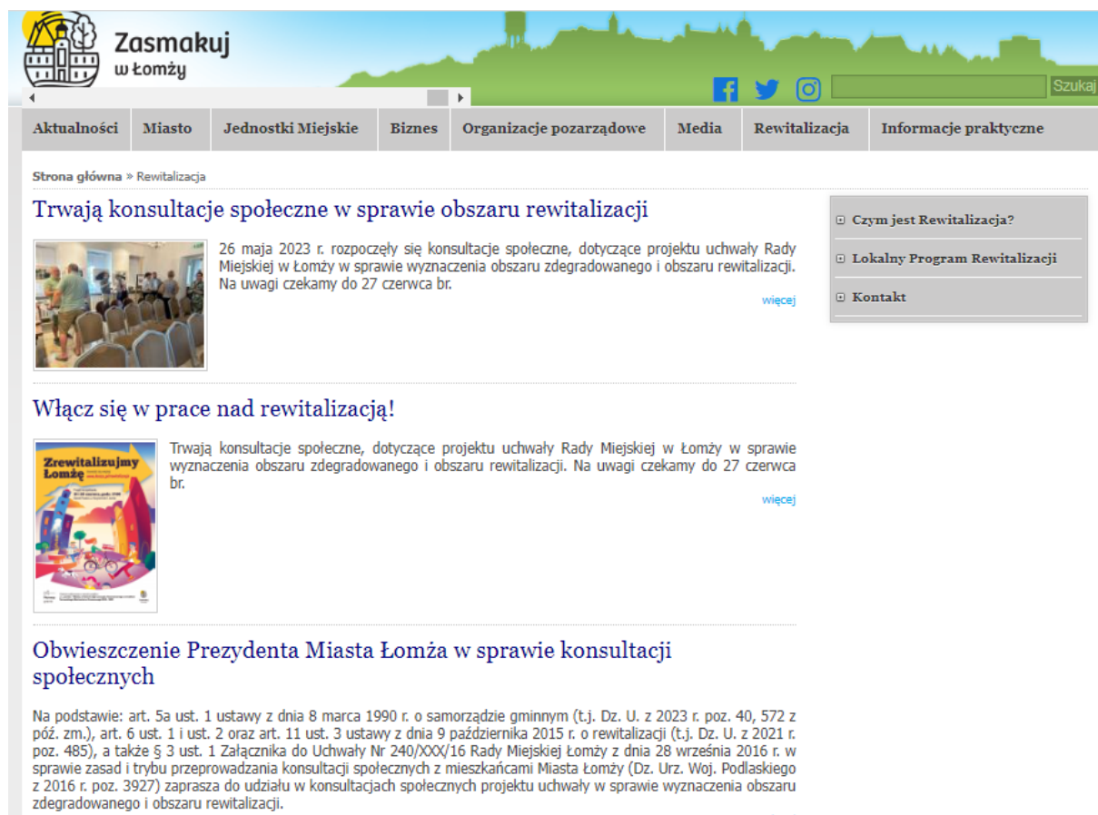
Fot. 1.