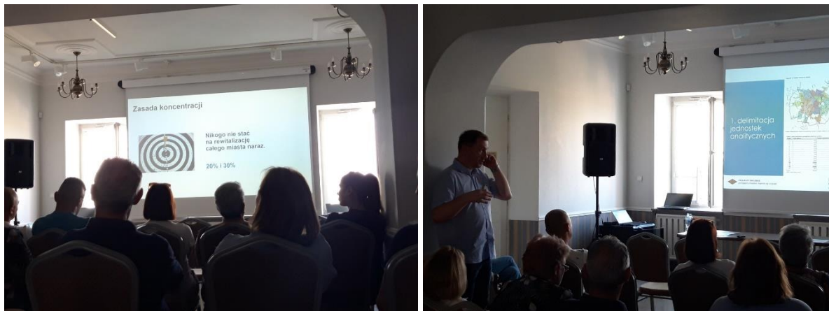
Fot. 3. Uczestnicy spotkania konsultacyjnego w dn. 19 czerwca 2023 r.

zaangażowania w wydarzenia konsultacyjne, planowane na okres po planowanym przyjęciu przez Radę Miejską w Łomży uchwały o przystąpieniu do prac nad Gminnym Programem Rewitalizacji.