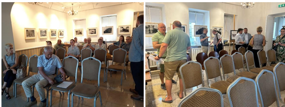
Fot. 4. Uczestnicy spotkania konsultacyjnego w dn. 20 czerwca 2023 r.