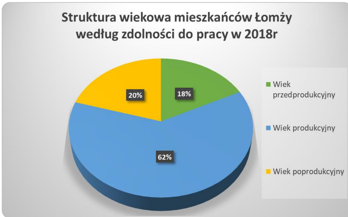
Wykres.1. Struktura wiekowa mieszkańców Łomży według zdolności do pracy.

Opracowanie MOPS w Łomży na podstawie danych UM w Łomży COM Oddział Ewidencji Ludności