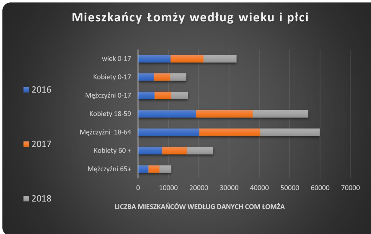
Wykres 2. Liczba mieszkańców Łomży według wieku i płci 2016-2018r

Opracowanie MOPS w Łomży na podstawie danych UM w Łomży COM Oddział Ewidencji Ludności