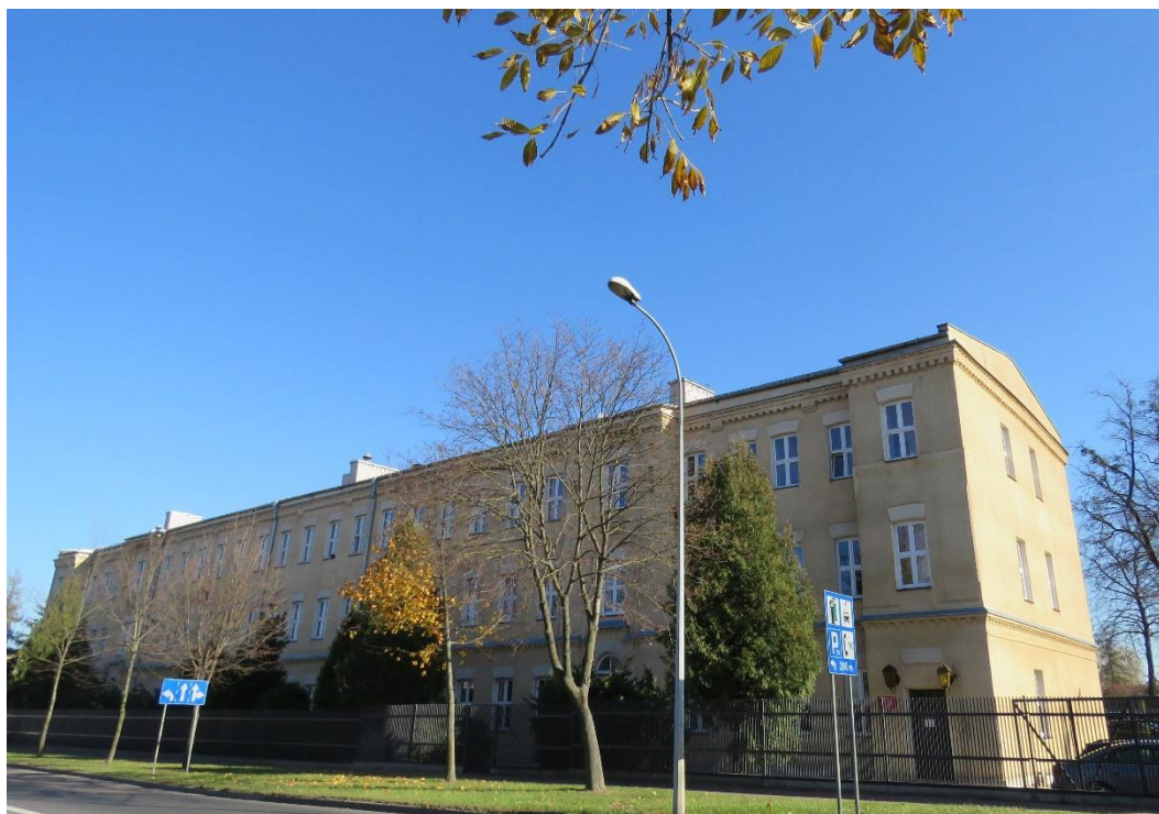
Budynek koszarowy, ul. Wojska Polskiego, 1899-1900 r.

W czasie II wojny światowej Łomża została zniszczona w 70%, głównie w wyniku walk prowadzonych w pierwszej połowie września 1944 r. Wcześniej, podczas okupacji niemieckiej w latach 1942-1944 hitlerowcy wymordowali ok. 7000 mieszkańców Łomży pochodzenia żydowskiego. Piętnastego lipca 1943 r. w Jeziorku dokonali mordu na 63 przedstawicielach inteligencji łomżyńskiej.