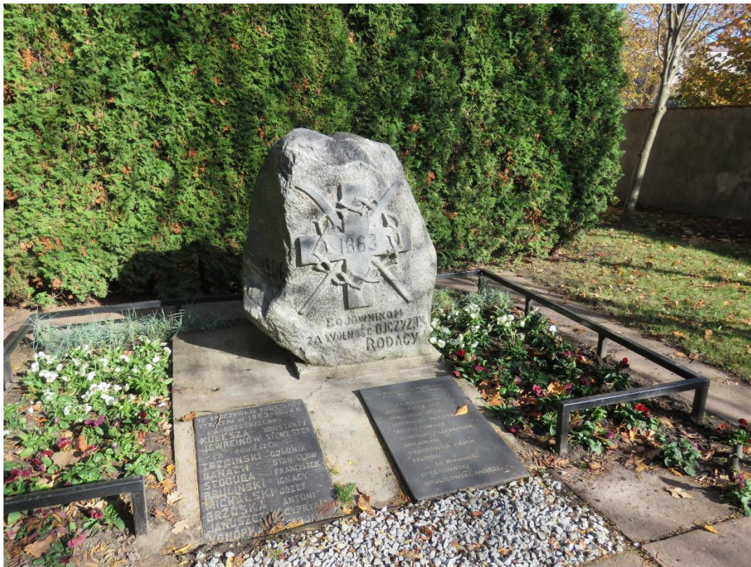
Cmentarz powstańców 1863 r., Szosa Zambrowska

Stopniowy rozwój miasta przerywany był wybuchami powstań narodowych: listopadowego i styczniowego, w których mieszkańcy Łomży brali czynny udział. Tragicznym epizodem powstania styczniowego było wymordowanie w 1863 r. przez kozaków pięćdziesięciu uczniów, którzy utworzyli oddział i podjęli próbę dołączenia do powstańców.