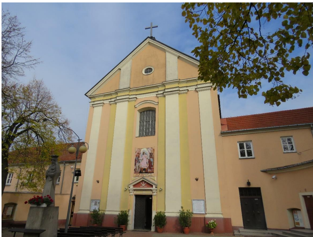
Fasada kościoła w zespole klasztoru o. Kapucynów, ul. Krzywe Koło, 1770-1772 r.