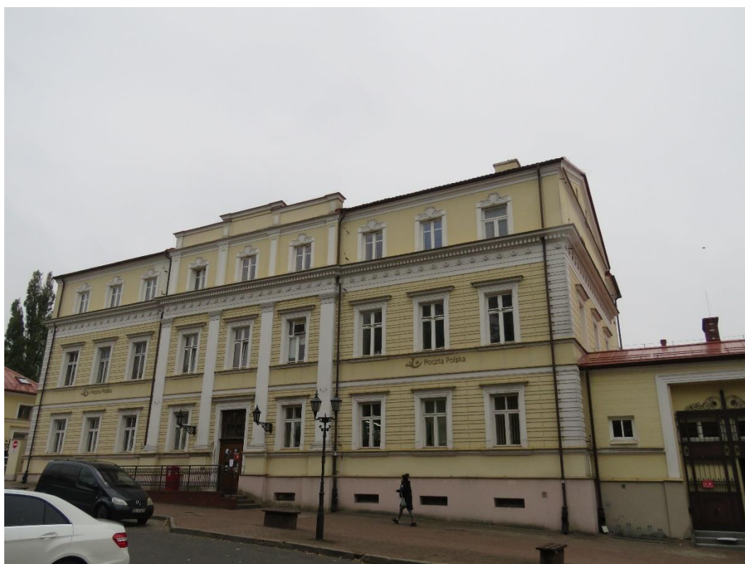
Budynek poczty, Plac Pocztowy, 1843-1844 r.