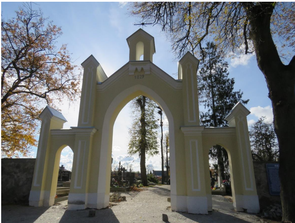
Brama cmentarza wielowyznaniowego przy ulicy Kopernika, 1829 r.

i Polowej oraz rozpoczęto sypanie grobli przez dolinę Narwi do Piątnicy. W mieście zaczęli osiedlać się kupcy i rzemieślnicy. Zaczęła tu również napływać ludność żydowska.