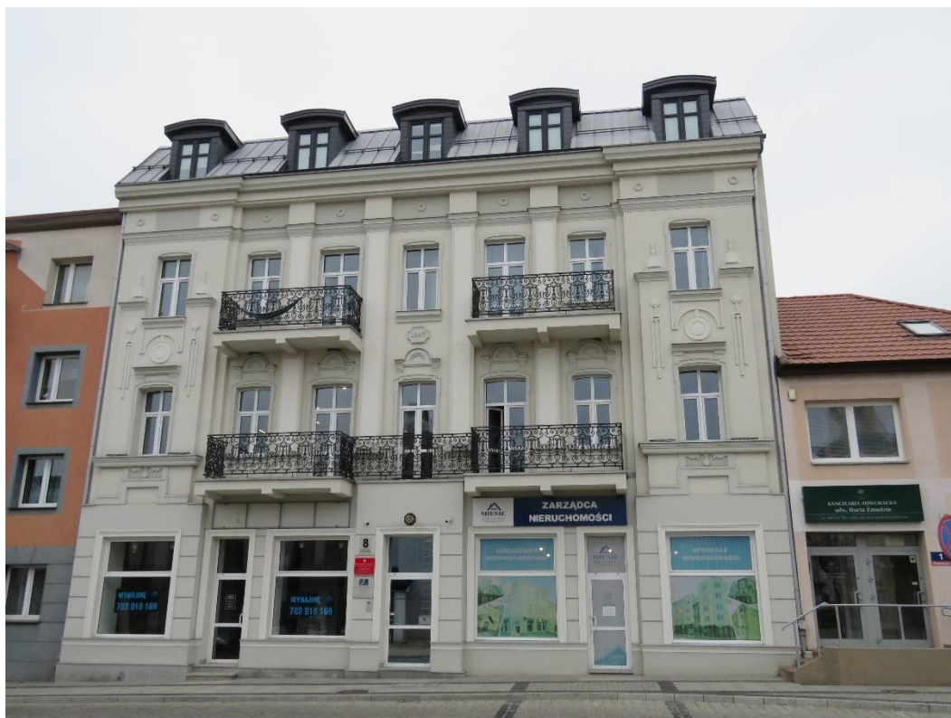
Kamienica, Stary Rynek, 4. ćwierć XIX w.