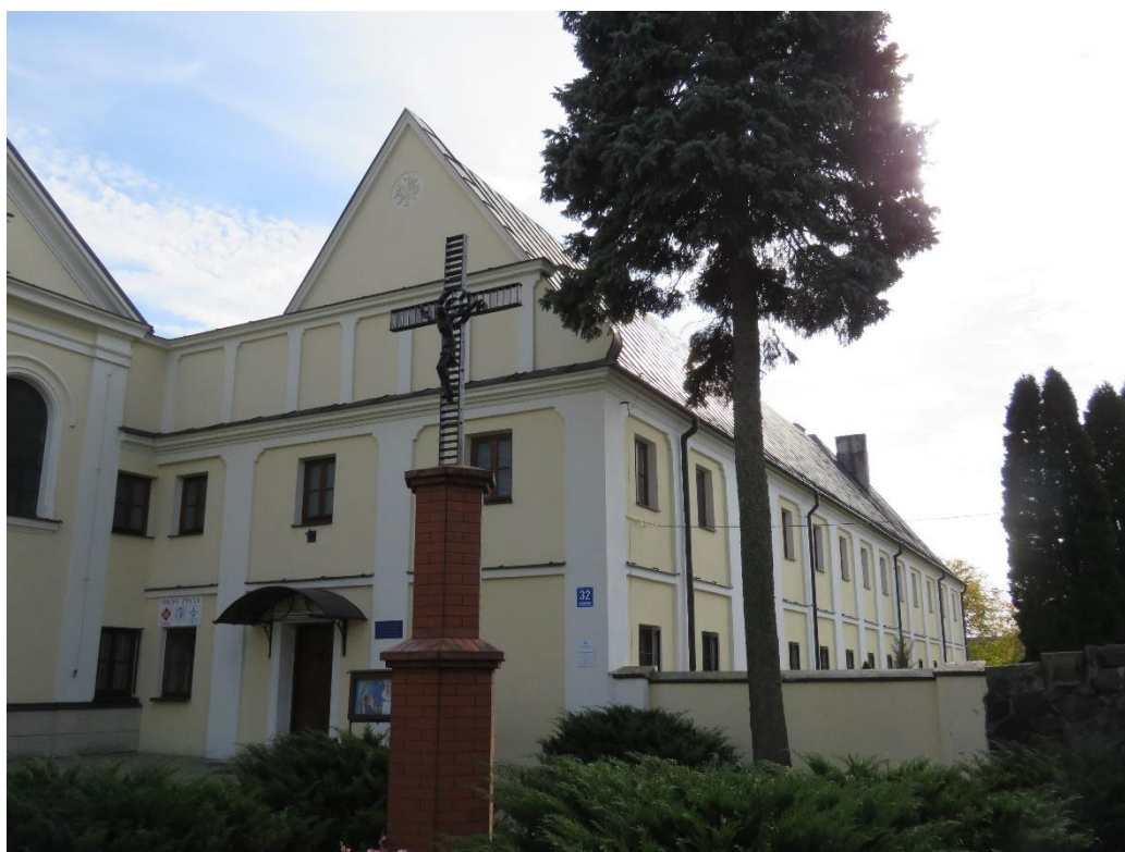
Klasztor benedyktynek, ul. Dworna, 1760-1764 r.

przemysłu leśnego oraz tranzyt soli, przypraw, piwa, wina, metali, sukna i produktów zwierzęcych. Rozwój ten przyczynił się do założenia w XVI w. w Łomży Nowego Miasta. Powstało ono na północny-zachód od Starego Rynku i posiadało własny rynek – dzisiejszy Plac T. Kościuszki. W tym czasie zabudowa mieszkalna miasta składała się z ok. 540 murowanych kamienic. Na Starym Rynku stał murowany ratusz. Do ważnych budynków należały też: siedem kościołów, trzypiętrowy dom wójtowski, łaźnia, magazyny soli i zboża (spichlerze), arsenał i ludwisarnia. W sąsiedztwie miasta, na Narwi działało osiem młynów. W 1558 r. Zygmunt August zezwolił mieszkańcom na budowę wodociągów. W XVII w. w Łomży wzniesiono dwa dalsze kościoły z klasztorami jezuitów i bernardynek. W 1616 r. powstało kolegium prowadzone przez jezuitów. W 1564 r. Łomża miała 3300 mieszkańców i to pomimo zarazy, która nawiedziła miasto w 1504 r. Zapewne do późniejszego spadku liczby mieszkańców przyczyniły się epidemie z lat: 1624, 1625, 1630 i 1653. Zabudowa miejska była okresowo niszczone przez pożary i powodzie. Pożary odnotowano w: 1521, 1538, 1590, 1618, 1620, 1631, 1635, 1641 i 1651r., a powodzie w: 1600 i 1631 r.