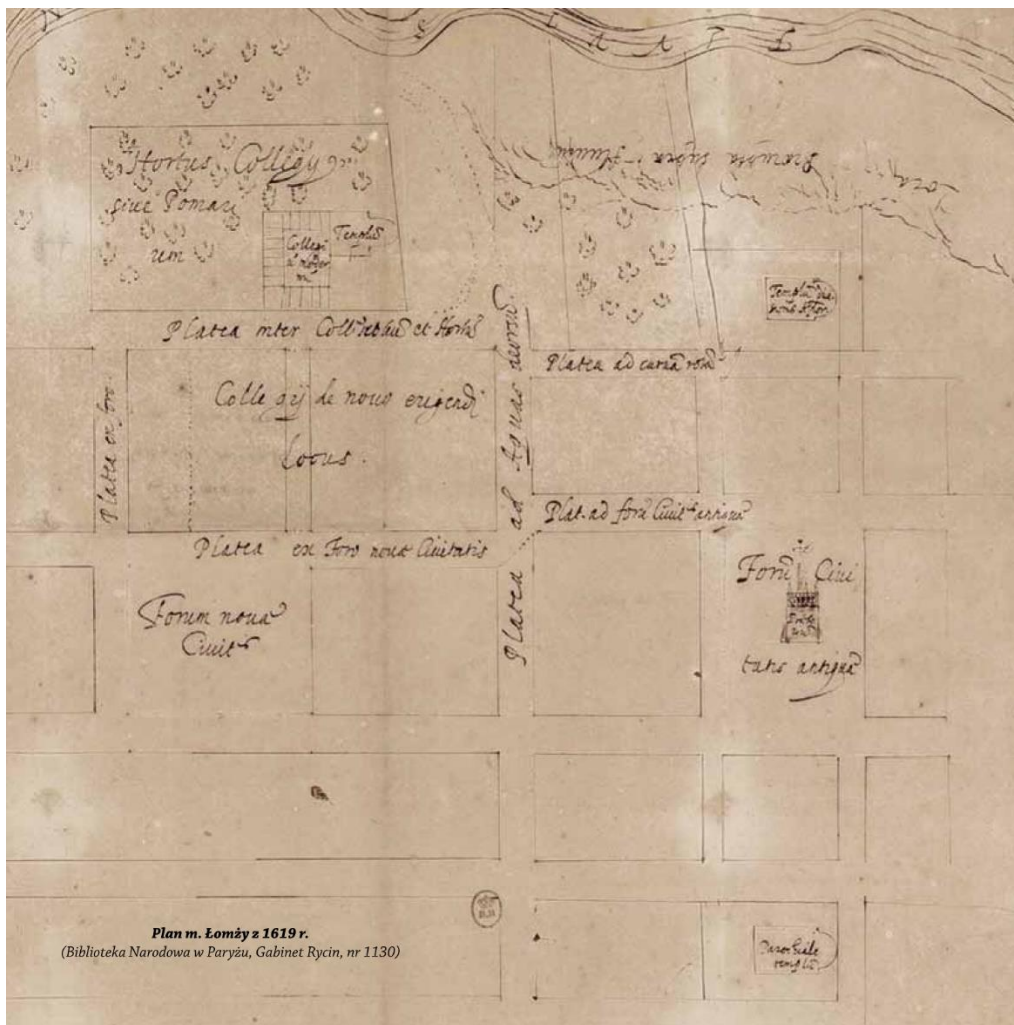
Stary i Nowy Rynek na planie Łomży z 1619 r.

Okres pomyślnego rozwoju Łomży trwał do pierwszej połowy XVII w. Upadek miasta przyniosły wojny szwedzkie i związane z nimi pożary oraz epidemie. Liczba ludności spadła wówczas do zaledwie 300 osób (w 1676 r.). Miasto płonęło w: 1696 i 1751 r. Zarazy odnotowano w latach: 1700, 1711, 1791 i 1800. Nastąpił upadek rzemiosł.