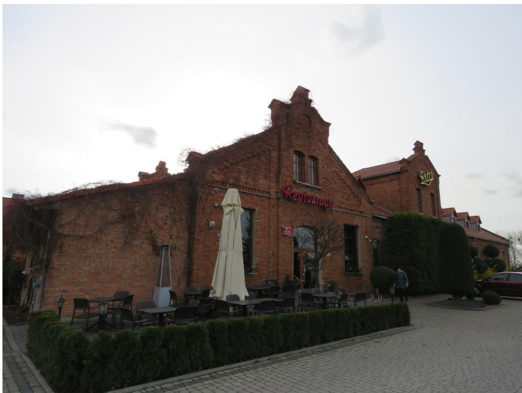
Hala główna w zespole rzeźni miejskiej, ul. Nowogrodzka, 1906 r.

Rozwijał się drobny przemysł. Jeszcze w 1860 r. powstała rafineria cukru, później zaś tartaki, dwa browary i dwie garbarnie, na początku wieku wzniesiono rzeźnię miejską. Od końca XIX w. Łomża stała się miastem garnizonowym. W latach 1887-1897 wokół miasta wzniesiono pięć fortów Twierdzy Łomża osłaniającej nadgraniczne tereny Cesarstwa Rosyjskiego od strony Prus Wschodnich. Fortyfikacje te nie spełniły swojej funkcji w czasie I wojny światowej, natomiast odegrały znaczącą rolę w 1920 r. podczas wojny polsko-bolszewickiej. Służyły też jako miejsce oporu wojsk polskich we wrześniu 1939 r.