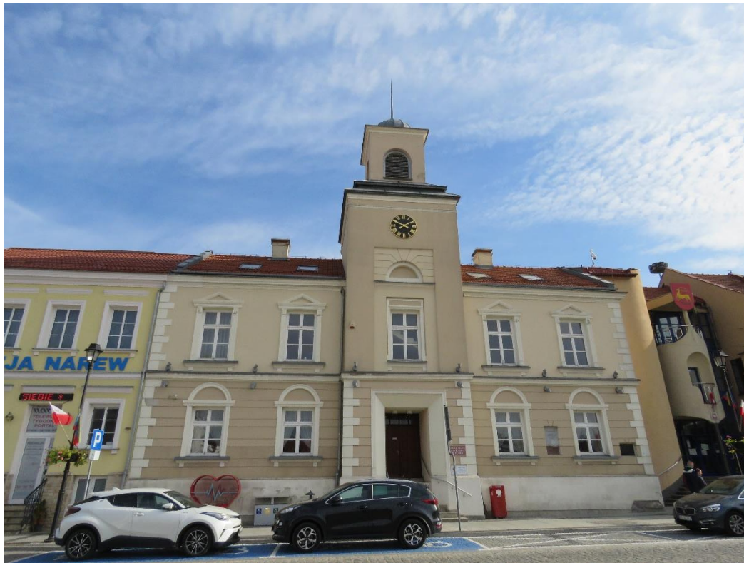
Budynek ratusza, Stary Rynek, 1822-1824 r.

Na lata 20. XIX w. przypadł stopniowy wzrost zaludnienia miast. W 1820 r. miało ono 2673, a w 1825 r. ok. 3300 mieszkańców. W 1820 r. zabudowa składała się z 251 domów. Rozwojowi handlu i budowie nowych domów sprzyjało osiedlanie się ludności żydowskiej. W połowie lat 20. XIX w. podjęto próbę rozwinięcia w Łomży przemysłu włókienniczego. W tym celu w 1826 r. zbudowano folusz i sześć domów dla tkaczy. Zamierzenie to zniweczył wybuch powstania listopadowego. Od końca pierwszej połowy lat 20. XIX w. prowadzona była regulacja zabudowy miasta. W 1824 r. wzniesiono nowy ratusz jednocześnie rozbierając stary. Przedłużono ul. Senatorską, co spowodowało konieczność zburzenia istniejącej jeszcze części gotyckiego zamku. Około 1840 r. pierzeje Nowego Rynku zabudowano murowanymi, jednopiętrowymi kamienicami. Obok wytyczono Plac Pocztowy i wzniesiono budynek poczty.