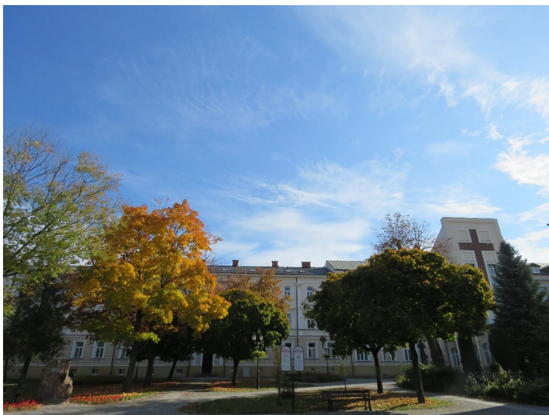
Pałac Gubernatora, ob. Wyższe Seminarium Duchowne, Plac Papieża Jana Pawła II, 1845 r.