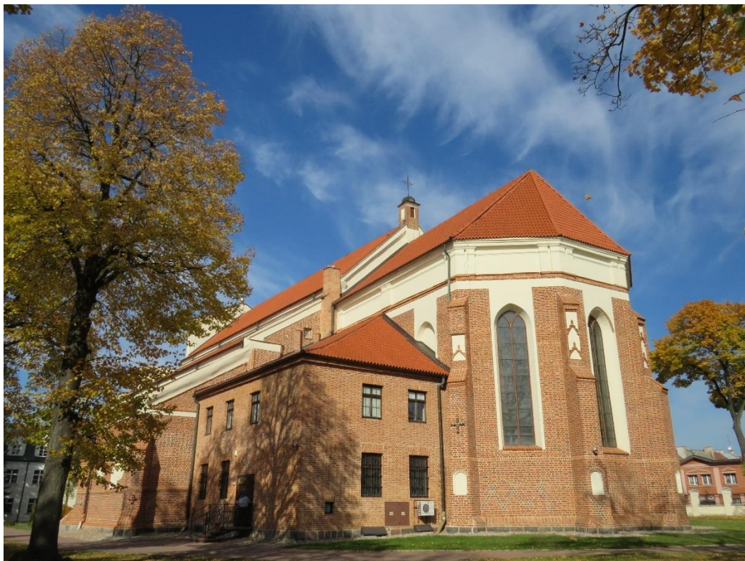
Kościół katedralny pw. św. Michała Archanioła i Jana Chrzciciela, ul. Dworna, 1525 r.

W latach 1504-1525 wzniesiono w Łomży murowany zamek. Jego rozbudowy dokonał książę Bolesław IV w latach 1453-1455. Zamek znajdował się we wschodniej części miasta, na skarpie, na lewym brzegu Narwi. Lustracje z lat: 1575 i 1588 wymieniają „zamek górny”, utożsamiany z domem gotyckim z czasów książąt mazowieckich. Wynika stąd, że rozbudowa zamku nastąpiła najprawdopodobniej za panowania Zygmunta I Starego i królowej Bony, a nowe zabudowania tworzyły zamek dolny. W XVII wieku zamek był mocno zniszczony: „we wszystkim jednak dworze ruina niemała”. Zapewne niedługo potem został opuszczony poza budynkiem zwanym skarbcem, który mógł być częścią gotyckiego zamku książąt mazowieckich. W domu tym mieściło się Archiwum Akt Ziemi Łomżyńskiej. W 1824 r. budynek został rozebrany. Wyniki przeprowadzonych w 1967 r. badań wykopaliskowych wskazują, że zamek znajdował się między ulicami Dworną i Senatorską.