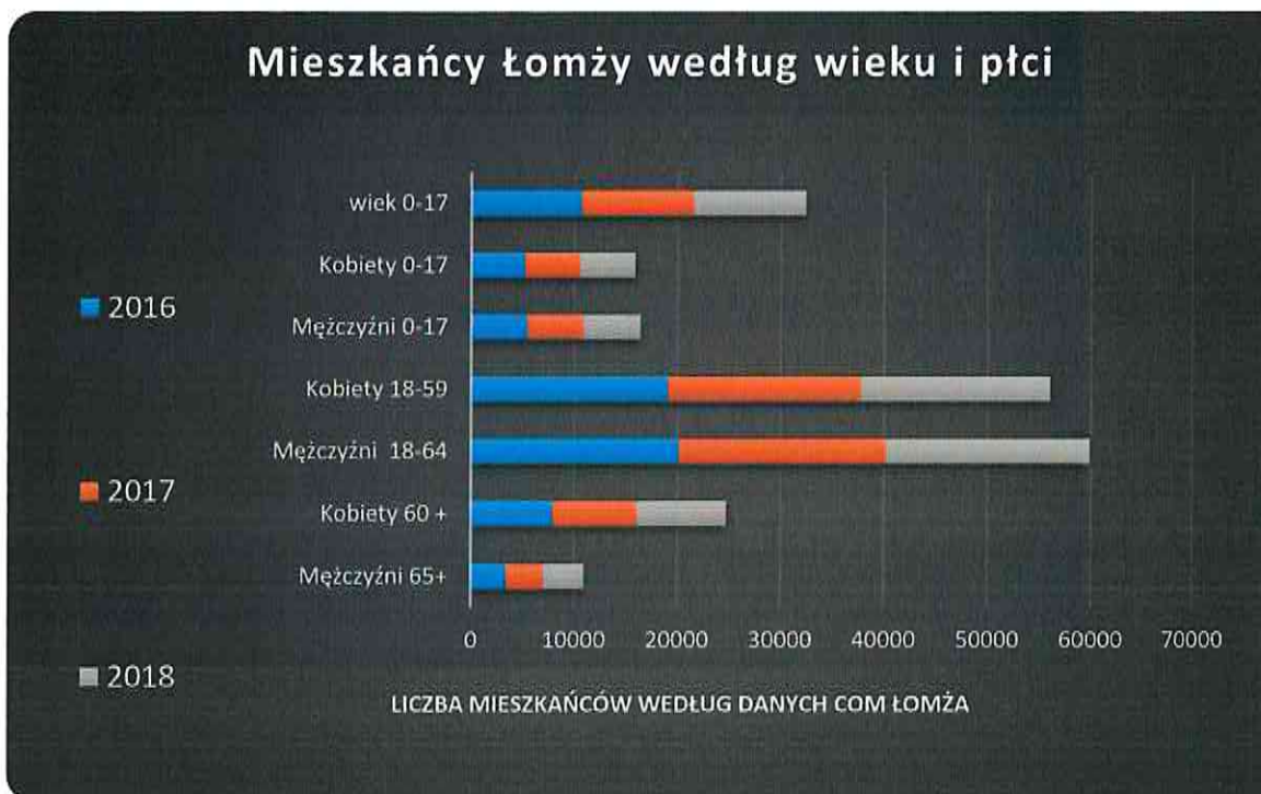
Wykres 2. Liczba mieszkańców Łomży według wieku i płci 2016-2018r

Opracowanie MOPS w Łomży na podstawie danych UM w Łomży COM Oddział Ewidencji Ludności