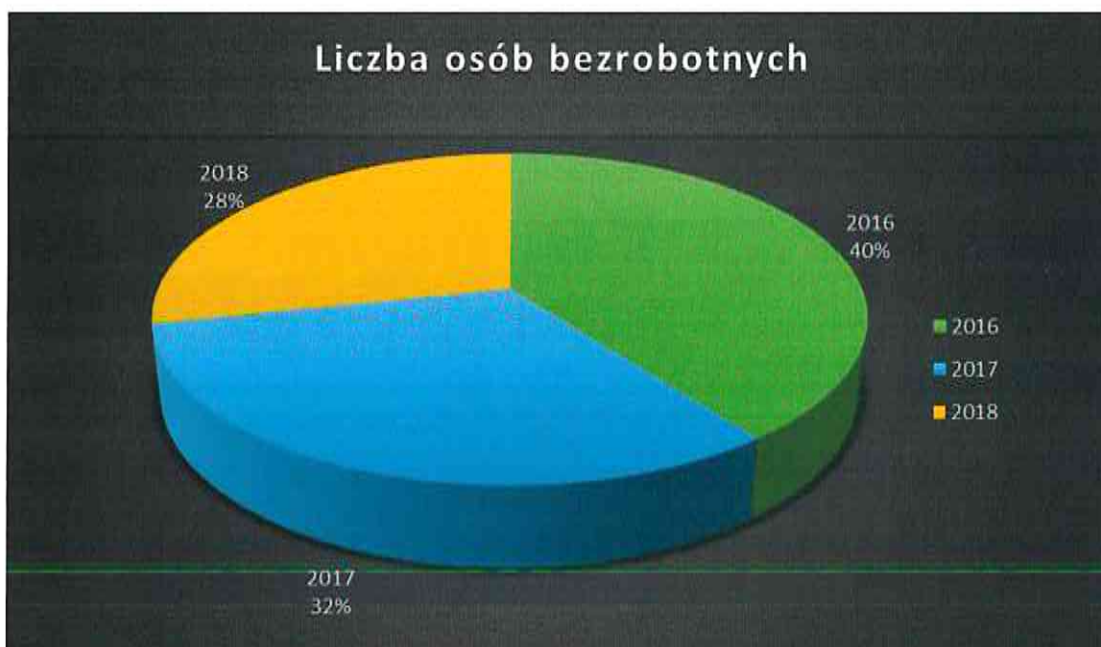
Wykres 4. Poziom bezrobocia w mieście Łomża w latach 2016-2018r

Niezwykle istotnym zjawiskiem dotyczącym rodziny i mającym decydujące znaczenie dla jej prawidłowego funkcjonowania ma bezrobocie. Osoby oraz rodziny nim dotknięte mogą ubiegać się o wsparcie we właściwych dla swojego miejsca zamieszkania urzędach pracy. W Łomży realizatorem programu w tym zakresie jest Powiatowy Urząd Pracy. Bezrobocie wpływa nie tylko na kondycję gospodarki miasta, ale przede wszystkim na funkcjonowanie całej rodziny. Niskie dochody oraz brak aktywności zawodowej dorosłych członków rodziny destabilizują jej sytuację oraz powodują degradację na wielu płaszczyznach. System pomocy osobom bezrobotnym to działania wielu instytucji poczynając od zadań powiatowych urzędów pracy, instrumentów rynku pracy, po zadania ośrodków pomocy społecznej. W Łomży jak wskazują dane z ubiegłych lat bezrobocie maleje.