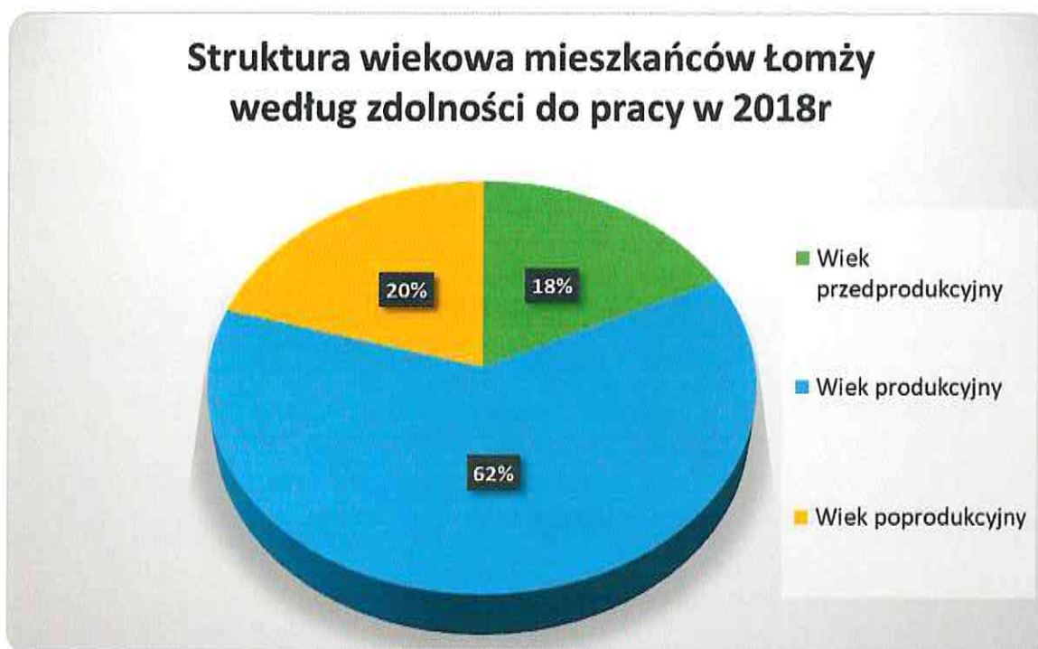
Wykres.1. Struktura wiekowa mieszkańców Łomży według zdolności do pracy.

Opracowanie MOPS w Łomży na podstawie danych UM w Łomży COM Oddział Ewidencji Ludności