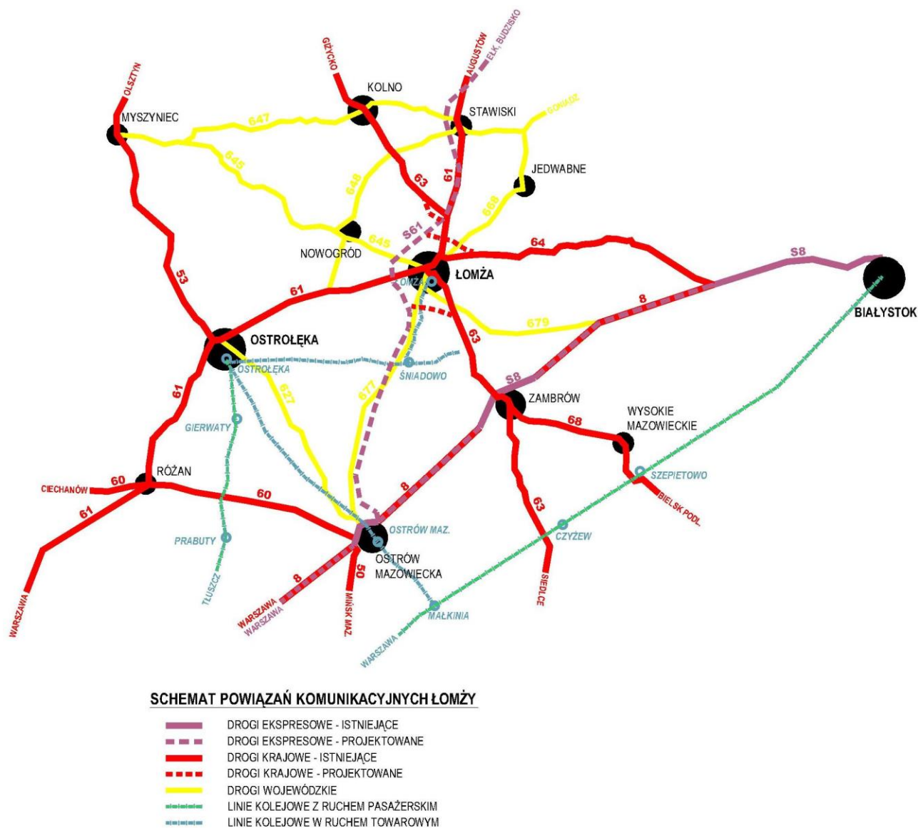
Rys. 1 Schemat powiązań komunikacyjnych Łomży